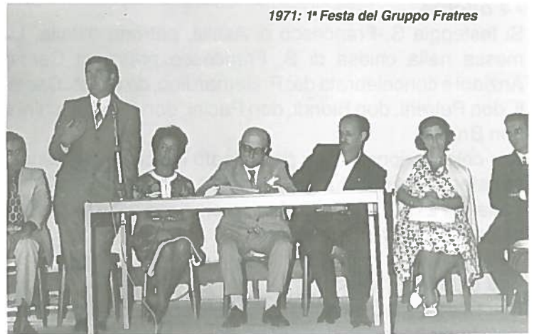
1971: 1ª Festa del Gruppo Fratres

- Alle ore 10 è stata deposta una composizione di fiori nel cimitero del capoluogo, sulla tomba di Pietro Gambogi,