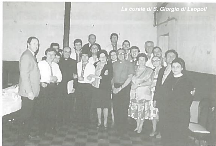
La corale di S. Giorgio di Leopoli