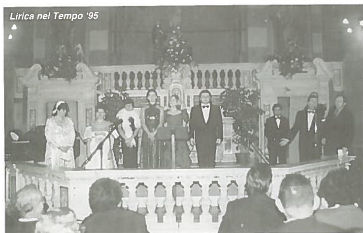
Lirica nel Tempo '95