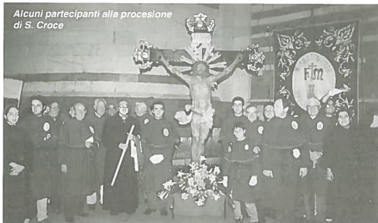
Alcuni partecipanti alla processione di S. Croce