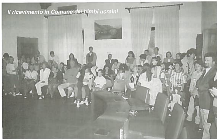
Il ricevimento in Comune dei bimbi ucraini