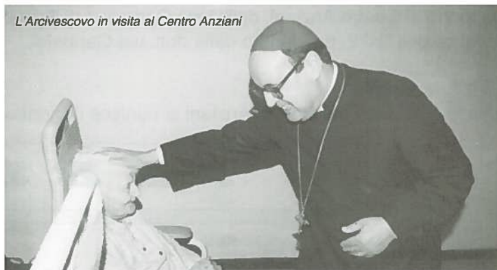
L'Arcivescovo in visita al Centro Anziani