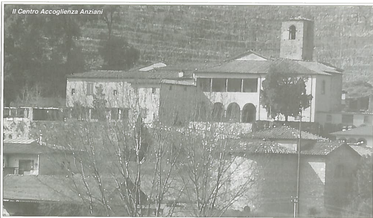
Il Centro Accoglienza Anziani

Alle ore 21 in Via Roma, nella chiesa del Crocifisso, si svolge l'assemblea generale dei soci della Misericordia, con l'approvazione della relazione morale e finanziaria sullo stato dell'istituzione e dei bilanci.