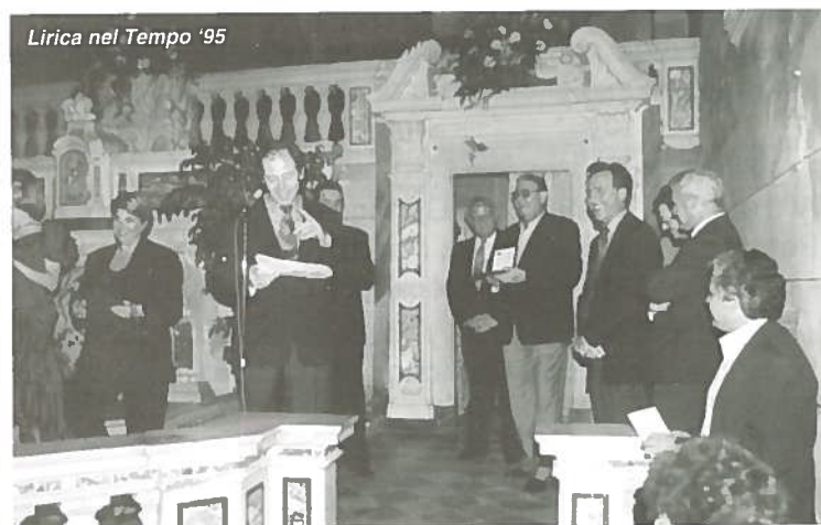
Lirica nel Tempo '95

La Compagnia della Misericordia, con il Cristo, il labaro e lo stendardo, partecipa alla tradizionale processione di S. Croce a Lucca.